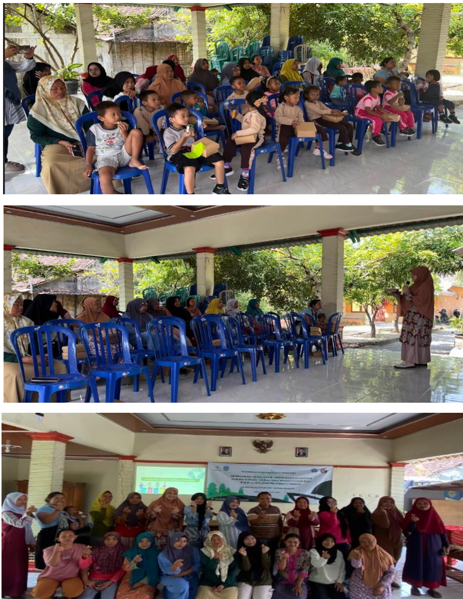
Gambar 1. Pelaksanaan Psikoedukasi Family Therapy