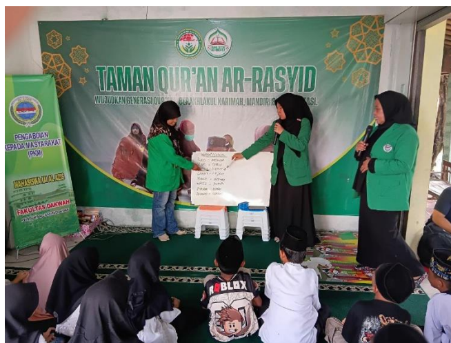
[Gambar 2. Belajar Mengenal Warna]

Sesi kedua berfokus pada pengenalan kosakata dasar sehari-hari, seperti nama-nama benda, warna, hewan, dan anggota keluarga. Dalam sesi ini, anak-anak sangat antusias mengikuti kegiatan, terutama ketika menggunakan flashcards bergambar yang berwarna-warni dan menarik. Media visual ini terbukti efektif dalam membantu anak-anak mengingat kosakata baru dengan lebih mudah. Hal ini sejalan dengan pendapat Wulandari (2020) yang menyatakan bahwa penggunaan media visual dapat meningkatkan penguasaan kosakata pada anak usia dini.