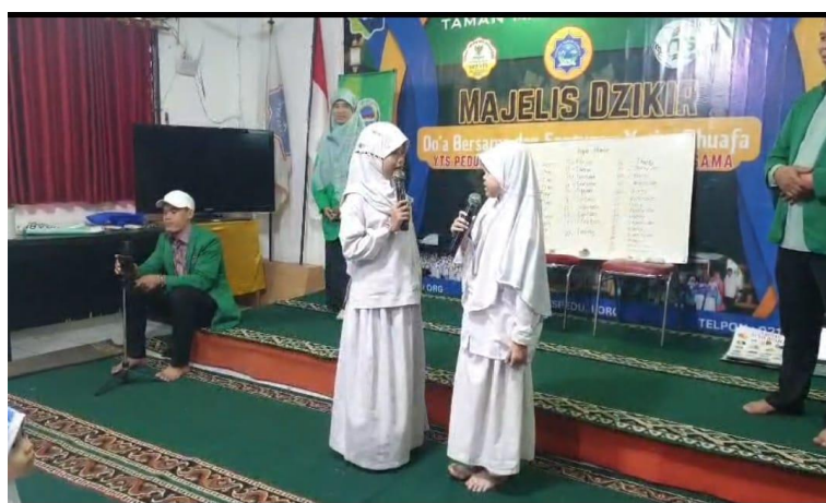
[Gambar 3. Pembelajaran Greeting]

Sesi ketiga adalah pembelajaran sapaan dan ungkapan sederhana (greetings, self-introduction, common expressions). Anak-anak diajak untuk berlatih memperkenalkan diri, menyapa teman, dan menggunakan ungkapan sederhana dalam situasi sehari-hari. Kegiatan role-play menjadi salah satu metode yang paling disukai oleh peserta, karena mereka dapat mempraktikkan langsung percakapan dalam konteks yang menyenangkan.