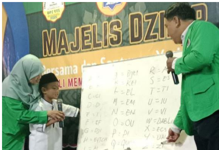
[Gambar 1. Belajar Mengenal Huruf A-Z]

Pelaksanaan kegiatan dilakukan selama tiga hari, yaitu tanggal 13-15 November 2025, dengan melibatkan 16 anak peserta dari tiga yayasan mitra. Kegiatan dibagi menjadi beberapa sesi pembelajaran yang dirancang secara terstruktur namun tetap menyenangkan. Sesi pertama difokuskan pada pengenalan alfabet dan angka, di mana anak-anak diajak untuk mengenal huruf A-Z serta angka 1-100 melalui lagu, flashcards, dan permainan interaktif.