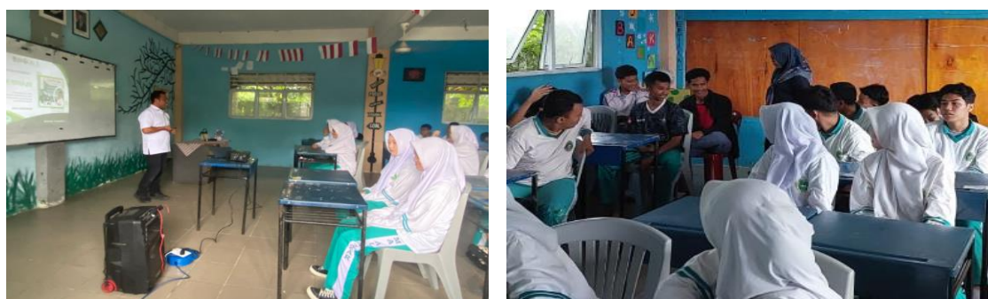
Gambar 5. Proses Pendampingan dan Diskusi

Tahap pendampingan dan diskusi merupakan lanjutan dari kegiatan sosialisasi yang bertujuan memperdalam pemahaman siswa terhadap materi engineering dan arah karier masa depan di era industri digital. Pada tahap ini, siswa tidak hanya berperan sebagai penerima informasi, tetapi juga dilibatkan secara aktif dalam proses pembelajaran melalui diskusi, tanya jawab, dan refleksi bersama.