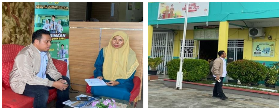
Gambar 2. Koordinasi Persiapan Kegiatan PKM

Tahap persiapan merupakan fondasi utama dalam pelaksanaan kegiatan Pengabdian kepada Masyarakat (PKM) di SMA Al-Azhar Batam. Tahap ini bertujuan untuk memastikan seluruh rangkaian kegiatan berjalan terencana, sistematis, dan sesuai dengan kebutuhan sasaran. Persiapan dilakukan melalui koordinasi intensif antara tim PKM dengan pihak sekolah guna menyepakati tujuan kegiatan, waktu pelaksanaan, jumlah peserta, serta fasilitas pendukung yang diperlukan.