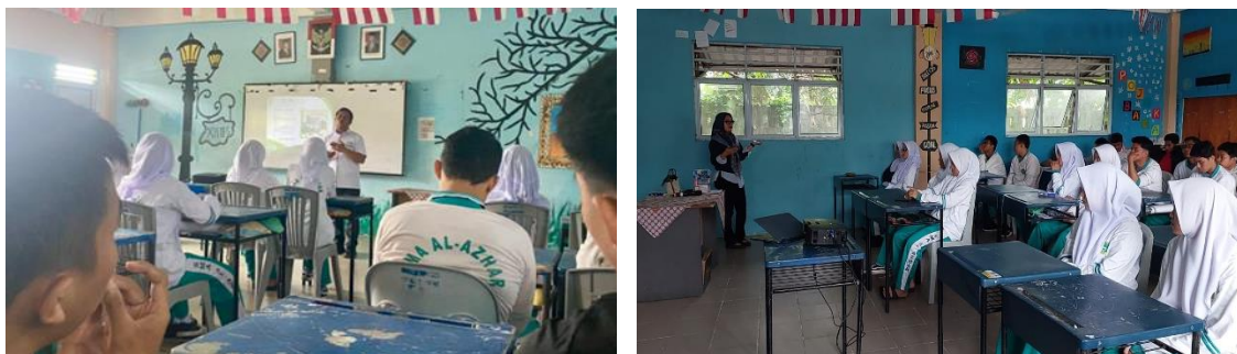
Gambar. 4 Proses Sosialisasi Kegiatan PKM

Tahap pelaksanaan sosialisasi merupakan inti dari kegiatan PKM yang bertujuan untuk meningkatkan pemahaman siswa mengenai engineering dan arah karier masa depan di era industri digital. Kegiatan sosialisasi dilaksanakan secara tatap muka dengan pendekatan edukatif dan interaktif, sehingga siswa tidak hanya menerima informasi, tetapi juga terlibat aktif dalam proses pembelajaran.