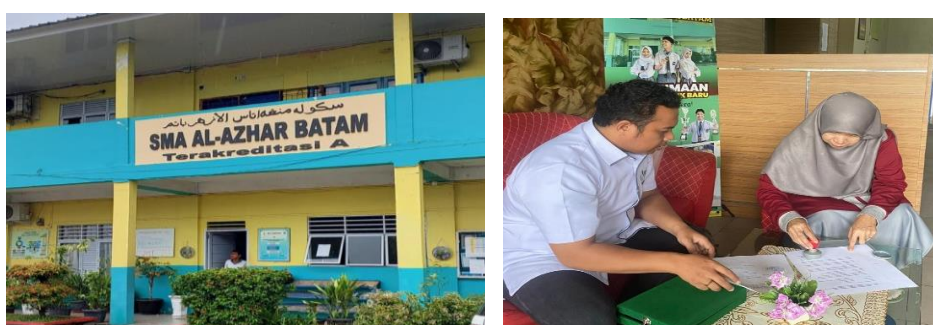
Gambar 1. Observasi, diskusi dan Penggalian Informasi Awal

Tahap identifikasi dan analisis merupakan langkah awal dalam pelaksanaan kegiatan Pengabdian kepada Masyarakat (PKM) di SMA Al-Azhar Batam. Tahap ini bertujuan untuk memperoleh gambaran awal mengenai tingkat pemahaman siswa terhadap engineering, perkembangan industri digital, serta kesadaran arah karier masa depan. Identifikasi dilakukan melalui observasi awal, diskusi dengan pihak sekolah, serta penggalian informasi mengenai minat dan kebutuhan siswa terkait pengenalan dunia industri dan profesi engineering.