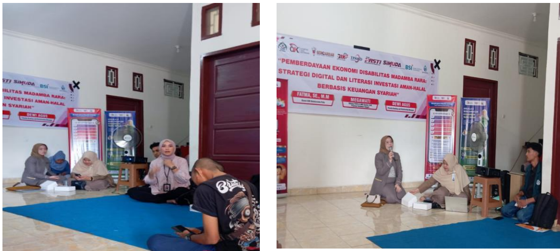
Gambar 2. Sesi Diskusi dan Pelatihan Literasi Digital

Sesi pelatihan dilakukan secara interaktif dengan metode ceramah, diskusi kelompok, dan praktik langsung. Narasumber memberikan materi tentang dasar-dasar literasi digital, termasuk penggunaan smartphone untuk keperluan bisnis, keamanan digital, dan etika berinteraksi di media sosial. Peserta tampak antusias mengikuti setiap sesi dan aktif bertanya terkait kendala yang selama ini mereka hadapi dalam memasarkan produk secara konvensional.