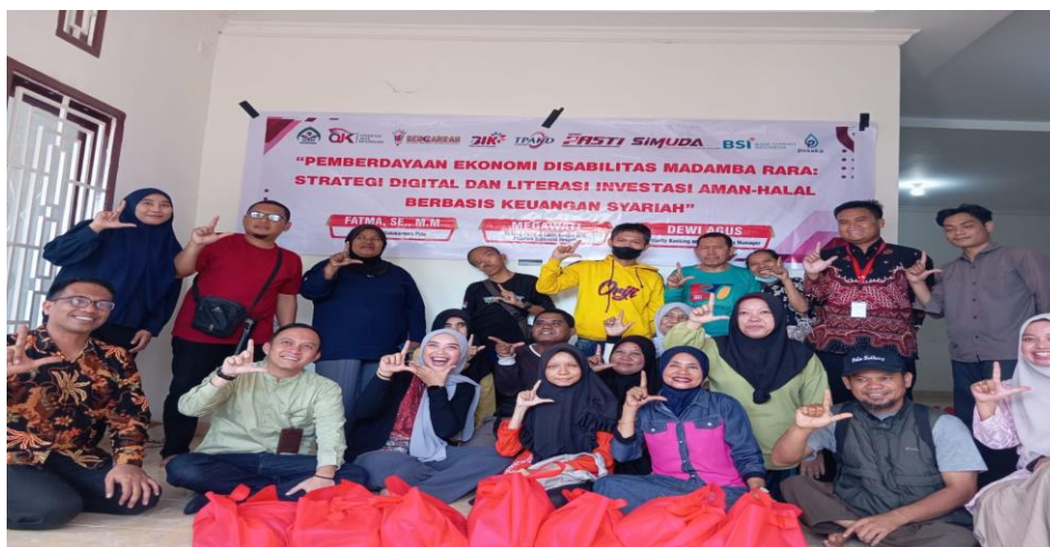
Gambar 1. Foto Bersama Peserta dan Tim PKM pada Kegiatan Pemberdayaan

Pelaksanaan program mengikuti tahapan pendekatan ABCD yang terdiri dari lima langkah utama, yaitu: (1) identifikasi aset komunitas melalui FGD dan wawancara mendalam untuk memetakan keterampilan, jejaring sosial, sarana produksi, dan potensi finansial yang dimiliki anggota forum; (2) membangun relasi dan kolaborasi internal dengan membentuk kelompok kerja berdasarkan jenis usaha; (3) fasilitasi pelatihan berbasis kebutuhan dan aset yang mencakup literasi digital dasar, pemanfaatan e-commerce, pemasaran digital, dan keuangan digital; (4) pemberdayaan melalui aksi nyata dengan implementasi langsung pembuatan akun toko online dan pengelolaan produk; serta (5) penguatan keberlanjutan melalui pendampingan dan evaluasi berkelanjutan.