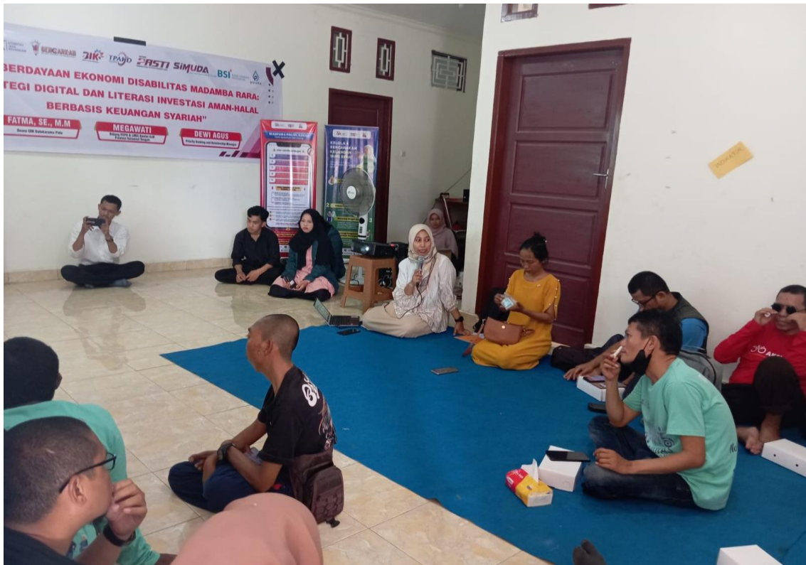
Gambar 3. Workshop Interaktif Pemanfaatan Platform Shopee

Sesi pelatihan dilakukan secara interaktif dengan metode ceramah, diskusi kelompok, dan praktik langsung. Narasumber memberikan materi tentang dasar-dasar literasi digital, termasuk penggunaan smartphone untuk keperluan bisnis, keamanan digital, dan etika berinteraksi di media sosial. Peserta tampak antusias mengikuti setiap sesi dan aktif bertanya terkait kendala yang selama ini mereka hadapi dalam memasarkan produk secara konvensional.