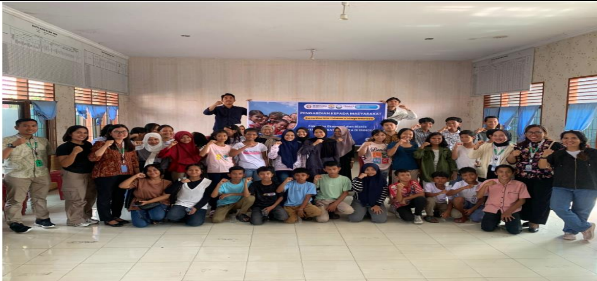
Gambar 1: Pelatihan Pengelolaan Keuangan dan Bisnis Digital

Sasaran utama kegiatan adalah pelajar yang telah terbiasa menggunakan gawai dan internet dalam keseharian, namun belum pernah mendapatkan pelatihan terstruktur mengenai pengelolaan keuangan pribadi dan bisnis digital (Ciptawaty & U, 2023). Pemilihan sasaran ini didasarkan pada karakteristik generasi muda yang dekat dengan teknologi, namun berisiko menghadapi masalah keuangan jika tidak dibekali literasi keuangan yang memadai (Anggarini et al., 2021). Metode pelaksanaan kegiatan mengikuti pola umum pengabdian kepada masyarakat berbasis pelatihan yang meliputi tahap persiapan, pelaksanaan, dan evaluasi (Ekadjaja et al., 2023; Nugraha et al., 2023; Nurhayati et al., 2022; Sadikin et al., 2024; Wijaya et al., 2022). Desain evaluasi menggunakan pendekatan one group pretest–posttest tanpa kelompok kontrol.