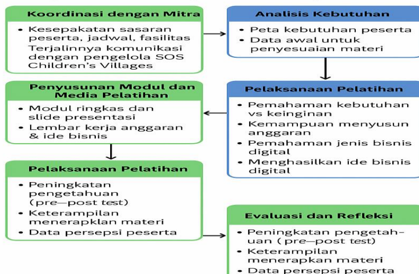
Gambar 2: Bagan Kerangka Capaian Kegiatan PKM