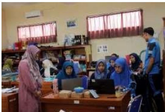
Gambar 4. Pendampingan Menyusun Perangkat Pembelajaran

Selama penyusunan RPP, instruktur mendampingi peserta pelatihan. Penugasan terstruktur untuk menyusun RPP diberikan kepada peserta pelatihan sebagai pengembangan kemampuan menyusun RPP. Target pencapaian kemampuan peserta pelatihan dalam menyusun RPP dengan baik sebesar 75% dari jumlah peserta secara keseluruhan. Kualitas RPP yang telah disusun peserta pelatihan dapat diukur menggunakan lembar penilaian dokumen.