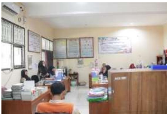
Gambar 7. Evaluasi Kegiatan

Evaluasi program setelah seluruh kegiatan pelatihan selesai dilakukan. Evaluasi kepuasan dengan memberikan angket penilaian program. Evaluasi dampak program dilakukan ketika peserta pelatihan melaksanakan aktivitas pembelajaran di sekolah masing-masing.