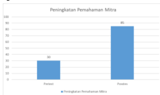
Grafik 2. Peningkatan Pemahaman Mitra

Efektivitas sosialisasi terhadap pemahaman konseptual guru, dilakukan pretes sebelum kegiatan dan postes setelah kegiatan. Hasil yang diperoleh, disajikan pada Grafik 2 menunjukkan peningkatan yang sangat signifikan.