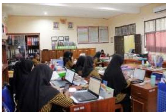
Gambar 5. Pendampingan Penggunaan Media BUSAPAKSA, DISABO, dan ALSAK

Kegiatan ini dilaksanakan menggunakan metode ceramah, diskusi, praktek, dan penugasan. Kegiatan di awal diberikan penjelasan materi tentang jenis-jenis media pembelajaran, karakteristik media dan manfaatnya, dan pemilihan media, serta penyusunan bahan ajar.