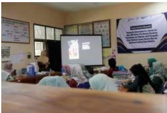
Gambar 3. Penyampaian materi

Kegiatan ini dilaksanakan dengan metode ceramah dan diskusi. Kegiatan diawal pelatihan berupa penyampaian materi tentang langkah-langkah perencanaan, pelaksanaan, dan penilaian pembelajaran.