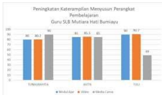
Grafik 1. Peningkatan Keterampilan Menyusun Perangkat Pembelajaran Guru SLB Mutiara Hati Bumiayu

yaitu Tunagrahita, Autisme, dan Tuli. Data peningkatan keterampilan menyusun perangkat pembelajaran guru SLB di SLB Mutiara Hati secara lengkap disajikan pada Grafik 1.