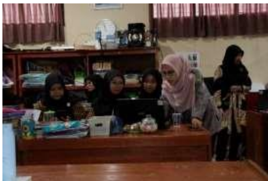
Gambar 6. Pendampingan Penyusunan Instrumen Penilaian

Kegiatan ini dilakukan dengan metode ceramah, diskusi, praktek, dan penugasan. Kegiatan pertama dijelaskan tentang teknik dan jenis penilaian proyek pada siswa, pedoman penskoran, dan penyusunan kisikisi penilaian.