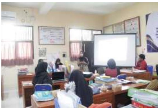
Gambar 2. Persiapan Pengabdian

Kegiatan persiapan terdiri dari (1) sosialisasi program kepada guru-guru. (2) Survei lokasi/tempat pelatihan bertujuan untuk memberikan kemudahan, dan kenyamanan kepada peserta selama pelatihan. Tempat dilaksanakannya pelatihan di mitra. (3) Penyusunan materi pelatihan. Hal ini dilakukan sebagai upaya mempersiapkan materi pelatihan yang lengkap dan menyeluruh. (4) Menyusun jadwal pelaksanaan pelatihan.