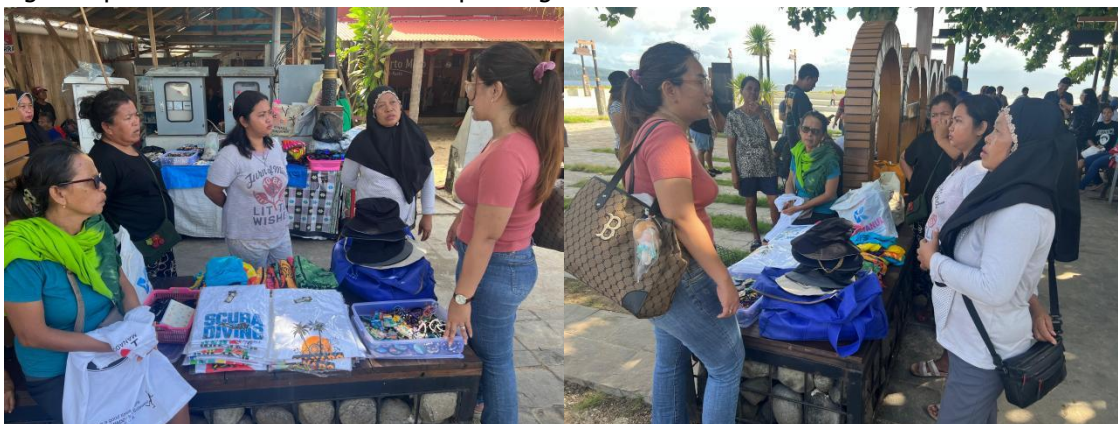
Gambar 1. Ketua Tim Pelaksana Melaksanakan Observasi dan Wawancara

permasalahan yang ada di carikan soulusi yaitu penerapan mesin (DTF) press sablon untuk membantu memproduksi cendramata secara mandiri. Dari sini telah disepakati solusi dan tanggal kegiatan pelaksanaan. Gambar 1. merupakan gambar saat observasi dan wawancara.