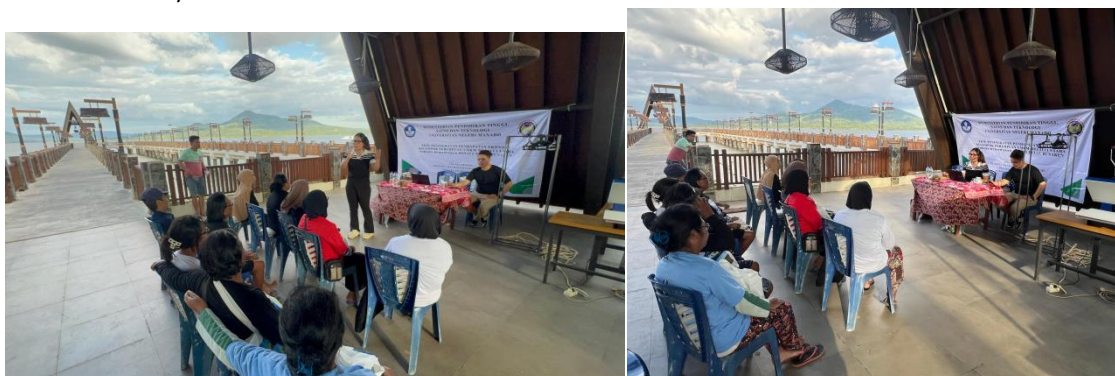
Gambar 2. Merupakan Kegiatan Saat Sosialisai/Deseminasi

Pada Kegiatan ini yang kedua adalah dilaksanakan sosialisasi/deseminasi pelaksanaan kegiatan yang di hadiri oleh anggota kelompok, pemerintah desa, dan juga tim pelaksanaan dosen dan mahasiswa Universitas Negeri Manado, Sekaligus Mahasiswa Universitas Gajah Madha yang melakukukan Kuliah Kerja Nyata (KKN) di Pulau Bunaken. Kegiatan sosialisasi ini bertujuan untuk meningkatkan pemahaman dari mitra terkait dengan penerapan teknologi Mesin DTF Press sablon, untuk produksi cendramata Kaos dan totebag secara mandiri. Gambar 2. merupakan kegiatan pada saat sosialisasi/deseminasi.