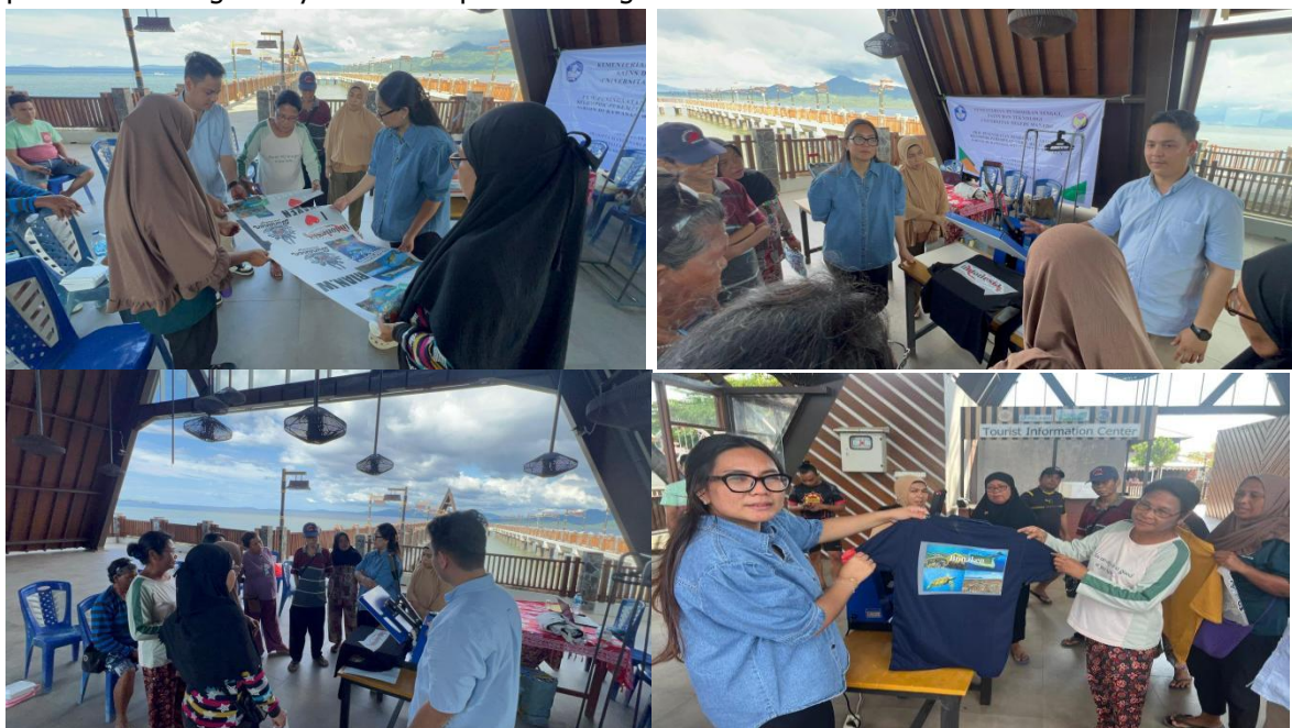
Gambar 3. Pelaksanaan Kegiatan dan Penerapan Teknologi Mesin Dtf Press Sablon

Pada kegiatan ketiga merupakan kegiatan pelaksanaan dan penereapan teknologi, sebelum kegiatan tim pelaksana menyerahkan alat teknologi dan beberapa alat dan bahan yang di perlukan untuk proses produksi selanjutnya tim pelaksana menjelaskan cara penggunaan mesin DTF Press sablon secara sederhana agar dengan mudah dapat di pahami oleh mitra, setelah itu tim pelaksana memberikan contoh dan mengoperasikan mesin DTF Press Sablon yang di saksikan oleh mitra sasaran, setelah di contohkan oleh tim pelaksana mitra mulai mencoba dan mengoperasikan secara mandiri mesin DTF press sablon untuk produksi secara mandiri. Gambar 3. Menunjukkan Proses pelaksanaan Kegiatan yaitu Penerapan Teknologi.