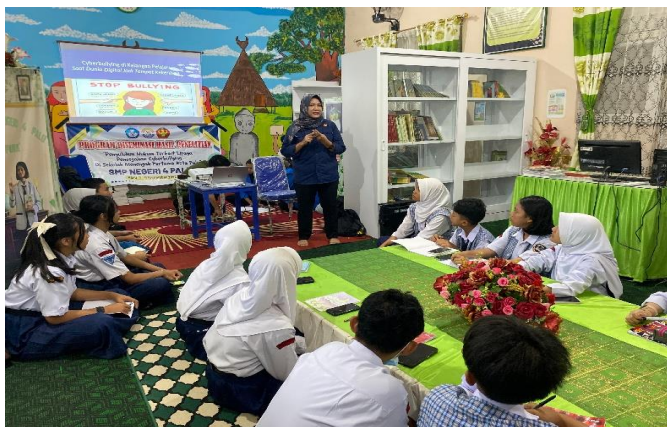
Gambar pelaksanaan kegiatan

Sebagai luaran akademik, hasil kegiatan pengabdian kepada masyarakat ini disusun dalam bentuk artikel ilmiah yang direncanakan untuk disubmit paling lambat pada Desember 2025, sebagai bagian dari kontribusi terhadap pengembangan keilmuan di bidang hukum siber, etika digital, dan perlindungan anak, serta sebagai bentuk pertanggungjawaban akademik atas pelaksanaan kegiatan pengabdian.