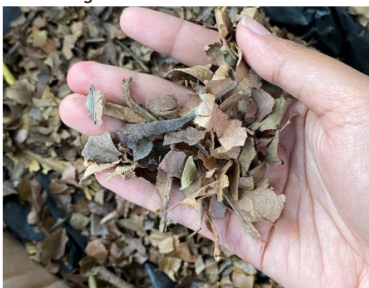
Gambar 3 Hasil Cacahan Daun Kering

Transformasi morfologi sampah daun menjadi serpihan berukuran kecil dan seragam ini memiliki implikasi krusial terhadap diversifikasi produk turunannya. Manfaat utama dari hasil cacahan ini adalah fungsinya sebagai material pre-compost yang sangat efektif. Dengan luas permukaan spesifik yang jauh lebih besar dibandingkan daun utuh, material ini memfasilitasi aktivitas mikroorganisme pengurai bekerja lebih agresif, sehingga durasi pengomposan dapat dipangkas secara signifikan. Hal ini menjadi solusi praktis bagi masyarakat yang selama ini enggan membuat kompos karena prosesnya yang dinilai memakan waktu lama.