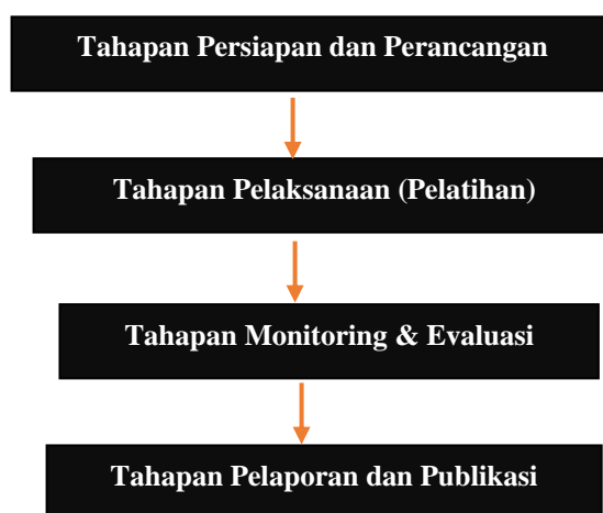
Gambar 1. Metode Pelaksanaan PKM

Metode pelaksanaan dalam Program Pengabdian Kepada Masyarakat dijelaskan pada bagan alir di bawah ini