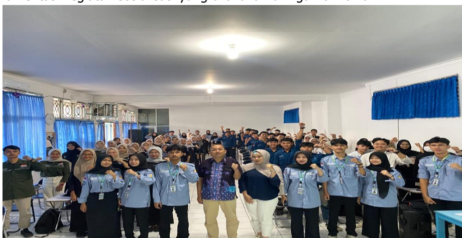
Gambar 1. Dokumentasi Kegiatan Sosialisasi

Pendidikan karakter menjadi vital dalam mewujudkan Indonesia yang mampu menghadapi tantangan global (Kulsum & Muhid, 2022). Upaya dalam mewujudkan peradaban bangsa dengan pendidikan karakter tidak pernah terlepas dari lingkungan pendidikan (Tripusat Pendidikan) yaitu dalam keluarga, sekolah dan Masyarakat (Aminah et al., 2022). Dengan keterlibatan aktif dari Tripusat Pendidikan ini, peserta didik tidak hanya memahami nilai-nilai karakter secara teoritis, tetapi juga menginternalisasikannya dalam kehidupan sehari-hari. Hasil posttest yang sangat positif tersebut mencerminkan bahwa pembinaan karakter yang dilakukan dalam lingkungan pendidikan telah berjalan efektif dan mendukung terwujudnya generasi yang berakhlak mulia, bertanggung jawab, serta mampu berkontribusi dalam membangun peradaban bangsa yang unggul. Berikut adalah dokumentasi kegiatan sosialisasi yang dilakukan di lingkungan ormawa: