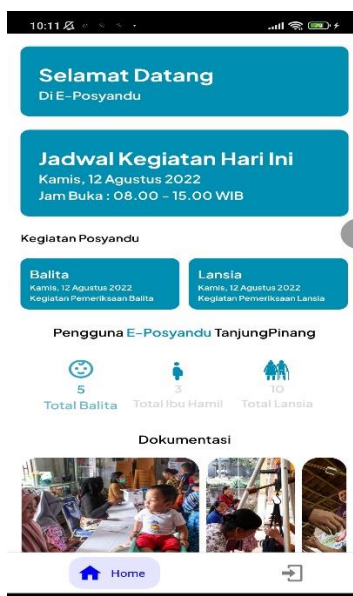
Gambar 2. Aplikasi E-Posyandu Berbasis Mobile

Sosialisasi dan Workshop E-Posyandu merupakan kegiatan pengabdian kepada masyarakat, dihadiri oleh 13 orang yang terdiri dari kader Posyandu Sei Jang Laut dan Posyandu Aisyiyah. Berikut adalah tampilan dari Aplikasi E-Posyandu