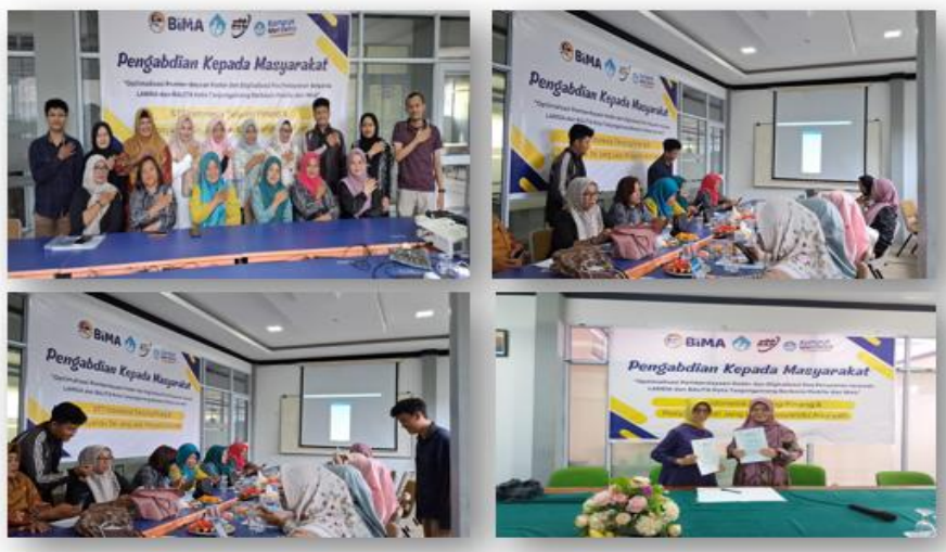
Gambar 3. Pelaksanaan Sosialisasi dan Workshop

Pelaksanaan PKM memberikan hasil positif dan signifikan yang dapat di rasakan langsung oleh peserta sosialisasi dan workshop, dimana program ini mampu memberikan kesempatan kepada kader posyandu untuk memahani aplikasi E-Posyandu untuk membuat administasi lebih rapih dan memudahkan dalam mengakses informasi. Hasil yang di peroleh dari pelatihan yang sudah di laksanakan peserta antusias bahkan hasil masukan dari kuisisioner yang di bagikan banyak masukan meminta untuk melaksanakan pelatihan serupa.