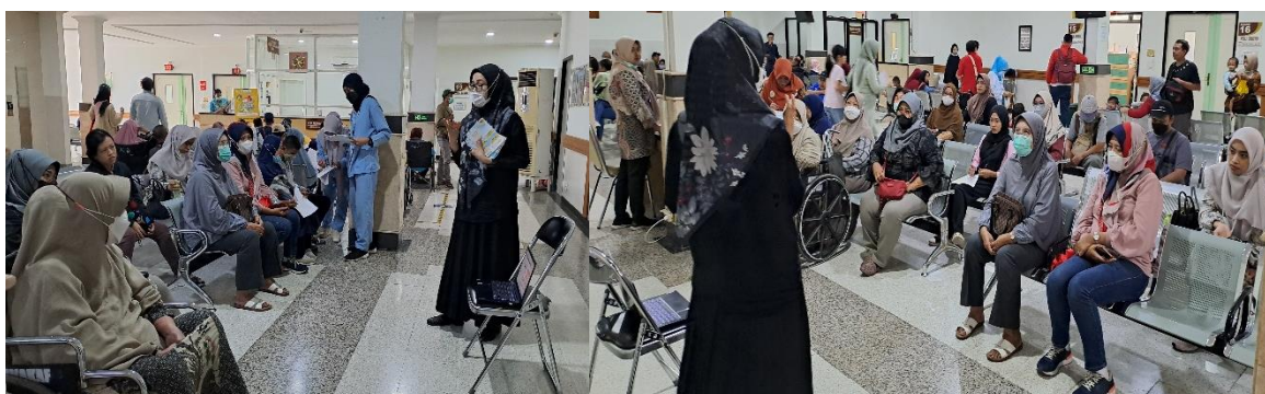
Gambar 2. Kegiatan Penyuluhan pada Pasien

Hasil pengisian kuesioner tertera pada Tabel 1. Dari hasil kuesioner didapatkan hasil bahwa sebanyak 20 orang (80%) pasien telah menggunakan sunscreen dalam kesehariannya. Jenis kulit yang dimiliki pasien antara lain; normal (8, 32%), kering (3, 12%), berminyak (8, 32%), kombinasi (4, 16%), dan sensitif (2, 8%). Mayoritas pasien (15, 60%) menggunakan tabir surya dengan kandungan SPF lebih dari 30, dan sebanyak 11 orang (44%) tidak melakukan reapply tabir surya.